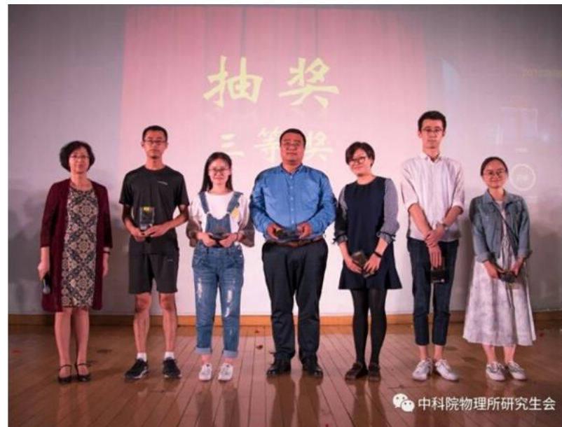
中秋晚会抽奖环节合影